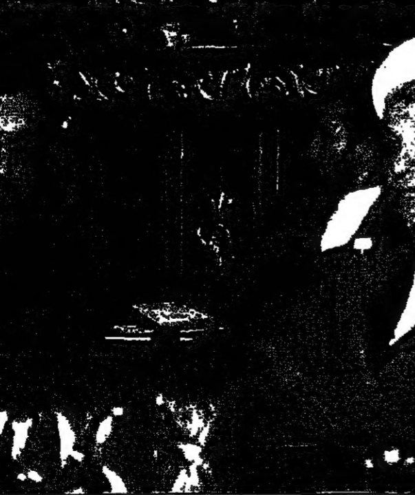
الرئيس الايراني علي اكبر هاشمي رفسنجاني ووزير الخارجية علي اكبر ولائي يستمعان لكلمات الوفد في المؤتمر

القدس العربية استخدمت لخدمة الامريكية في النقص والتعويض مع صور فرار عن جاس الامن بين الاسرئيليين في القدس الشرقية. وقالت صحيفة (الثورة) الرسمية ان واشنطن ارادت من استخدام حق النقض من تلغى ان الصرب ان الحماية الامريكية لاسرائيل لوق اعتبارا فوق السلام وان واشنطن تترخي حمة اسرائيل واطامها ومشروعها العدائي الروسي. وحذرت الصحفية نفسها من ان يجري الاستخدام للقدس حق النقض (الفيتو) ضد قرار مجلس الامن بتجاهل عمل دعواتي كبري يهدد المنطقة لفي فيه الخرج لها للهرب من مصاعبها واثرها الداخلية والافلات من عزلتها الدولية الخائفة. من جهتها اعترفت صحيفة (تشرين) الحكومية ان الاسرائيليين يريدون كليا على عملية السلام وكتبوا في المنطقة رما على عقب. ومن خلال دفعها الى هجرها الهاوية، وزات ان حكومة نتنياهو متحملة مسؤولية ما سيقرب على نهجها من كوارث وويلات وصراخ لا تقتصر آثارها على المنطقة فحسب بل تمتد لتشمل السلام والامن الدوليين. ونقلت صحيفة (سبيا تاير) التي تصدر باللغة الانكليزية اس الاحد ان سياسات نتنياهو في السب